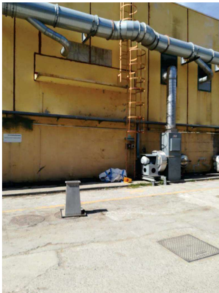
Foto 1 – Vista della porzione di fabbricato dove aprire il nuovo varco di ingresso